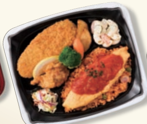
本体 白 中皿 黒