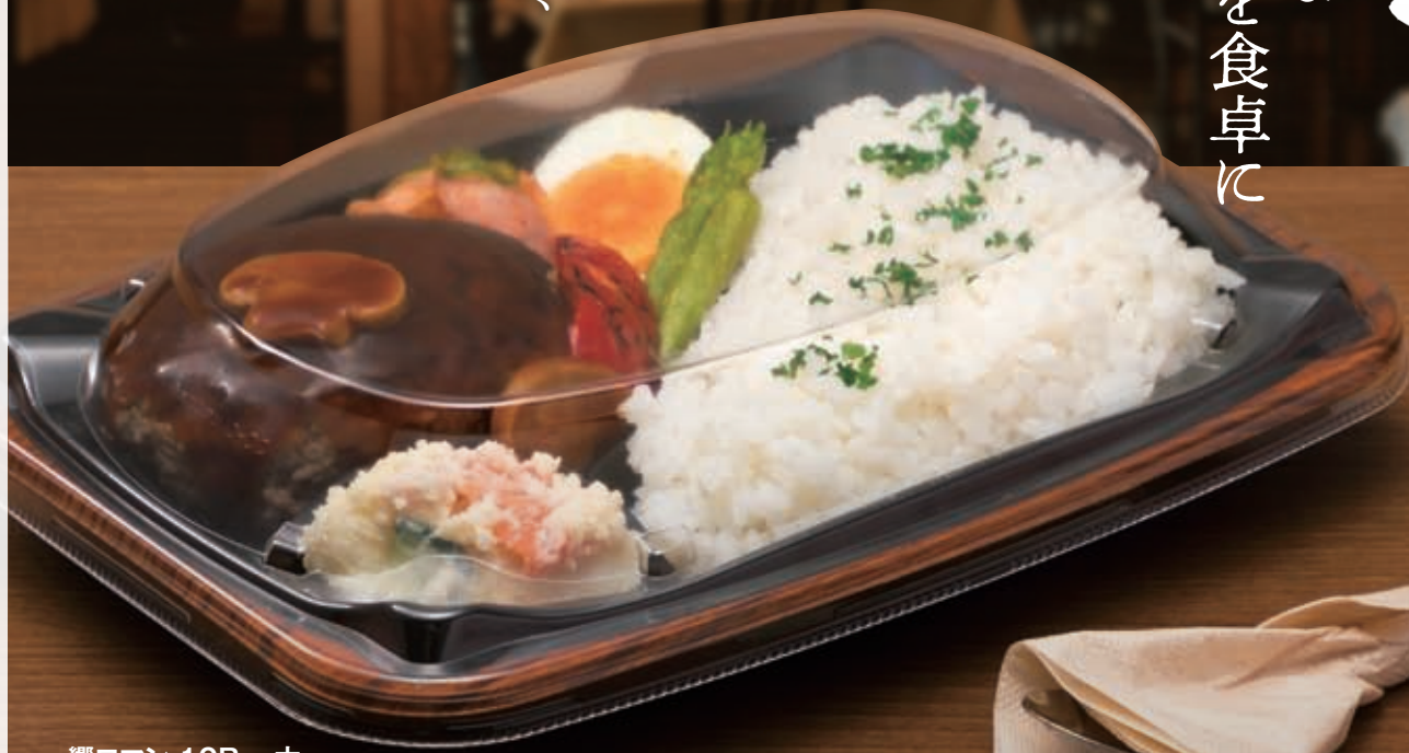
饗ロマン 10B 一木

そうして生まれた饗ロマンは、 「ちよつとハイカラな贅沢を 食卓に」お届けできる、 ロマンのある容器です。