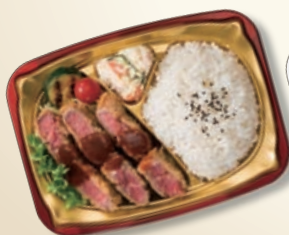
本体 ソフレッド 中皿 ゴールドW