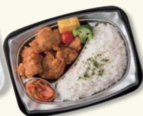
本体 黒 中皿 シルバーW