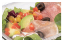
新サラダ・カットフルーツ容器 アソートケース