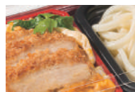
新麺セット容器 楽麺コンボ