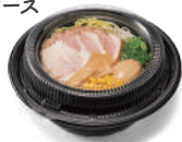
テイクアウト専用容器 麺丼2