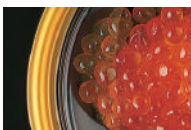
新漬せる珍味容器