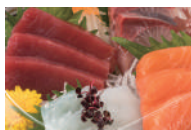
新バイオ刺身容器