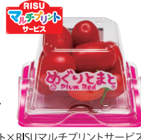
キューゲイト×RISUマルチプリントサービス