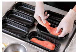
ベックッカー デリシェフ