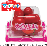
キューゲイト×RISUマルチプリントサービス