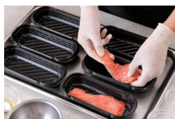
ペットコッカー デリシェフ