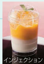
インジェクション