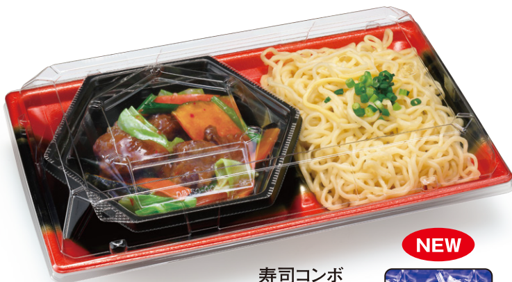
寿司コンボ 1B 夕なぎ赤