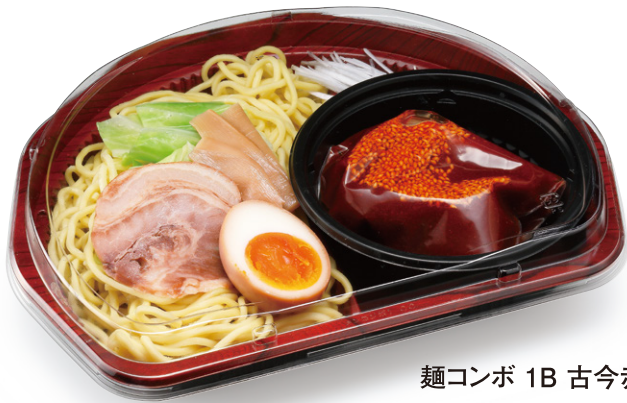
麺コンボ 1B 古今赤