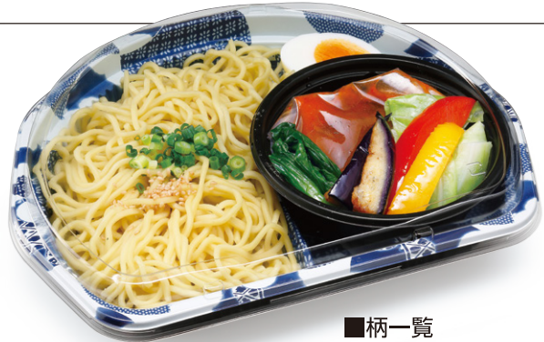
麺コンボ 1B 染付青