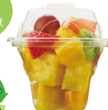
ニュートカップ エコハ